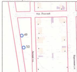
Фрагмент поселка индивидуальной жилой застройки