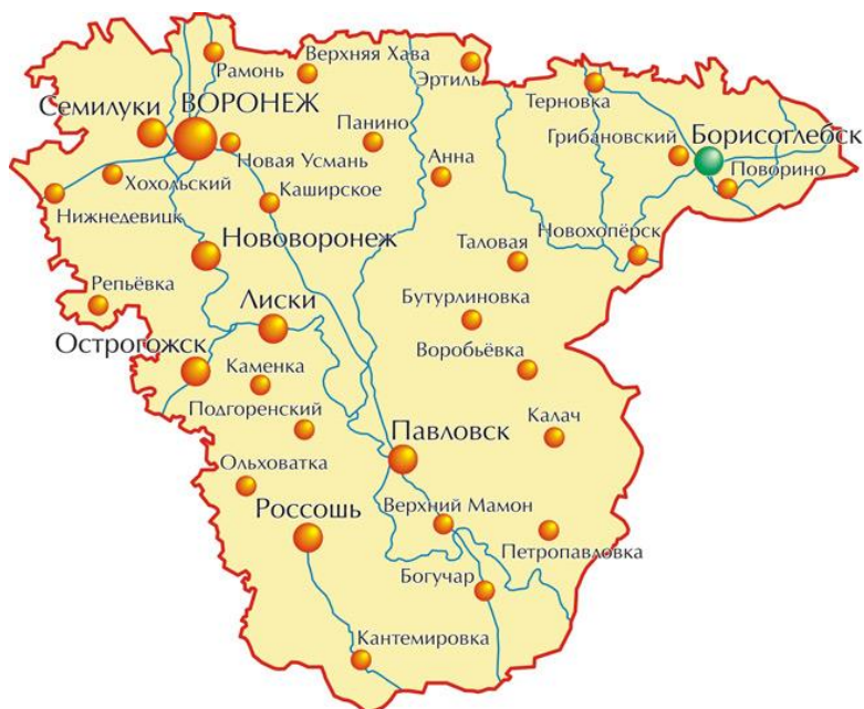
Рисунок 2.1 – Месторасположения городского округа город Нововоронеж на карте Воронежской области

Современная планировочная ситуация городского округа город Нововоронеж сформировалась на основе ряда факторов: