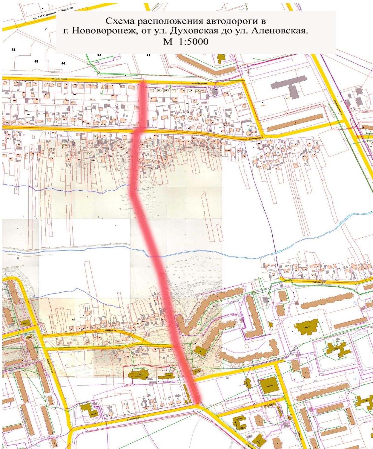
Схема расположения автодороги в г. Нововоронеж, от ул. Духовская до ул. Аленовская. М 1:5000