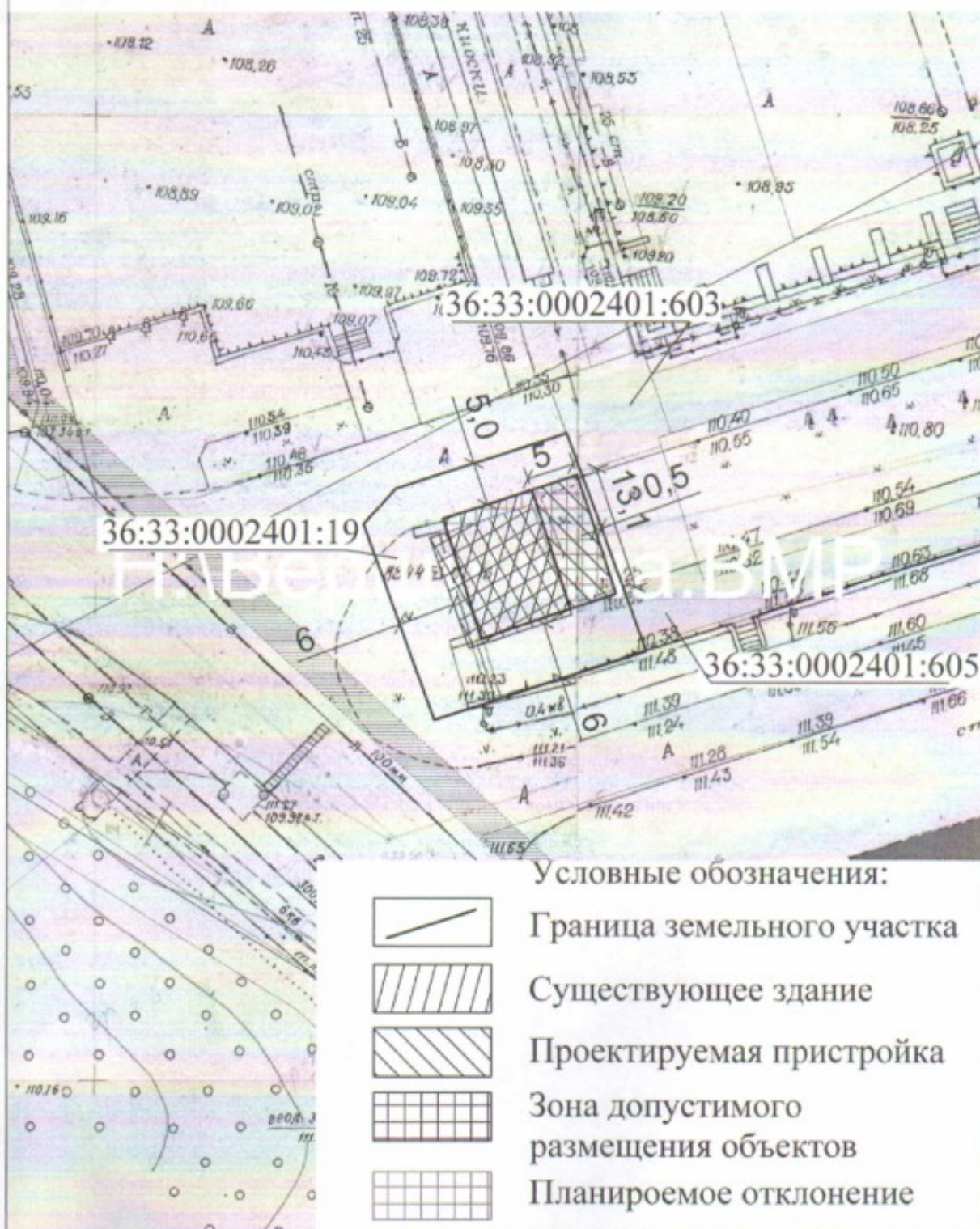
Схема размещения реконструируемого здания расположенного по адресу: г. Нововоронеж, Парковый проезд, 12